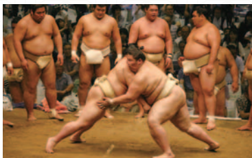
①熱のこもった朝稽古

昨年8月11日、三友エンジニア体育文化センターで開催された「大相撲夏巡業 大相撲かみのやま温泉場所」は、大勢の相撲ファンが来場し、相撲協会関係者・実行委員会スタッフを含めて2900名を超える方々で満員となり、大成功の内に終了しました。時間がない中でご協力をいただいた実行委員の皆様へ改めて感謝申し上げます。10日前に先乗りした担当親方の指導を受けながら当日の開催となりましたが、迫力ある取組と普段見ることができない大相撲の醍醐味に触れることができ、来場されたお客様も満足感にあふれていました。