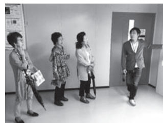
米沢市 山形大学工学部