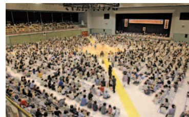
⑥熱気に包まれたアリーナ