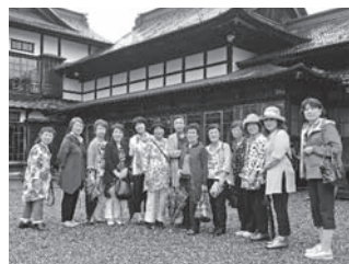
米沢市 上杉伯爵亭