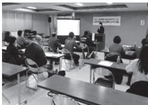
(昨年度 セミナー風景)