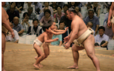
④ちびっ子相撲、38人の小学生参加