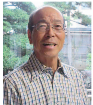
●マイブーム 温泉でリフレッシュ 仕事の疲れとストレスの解消

(株) 笹原材木店は製材と建築資材卸売をしている会社です。 山形県産・上山市産杉材を製材して住宅建築に使用します。 この杉材は樹齢60年以上で直径が30cm以上の良材で、住宅内部の主に柱など内装材に使われます。 内装材に使用することで、梅雨の季節は湿気を吸収し、乾燥する冬場は湿気を排出して室内環境を整え、住む人の健康にも役立ちます。また、木目を見ると心が落ち着いて安らぎます。 上山小学校建設では、上山木材納入組合の一員として上山市産杉材の内部化粧板を納入させていただきました。生徒や先生方に喜んでいただき、嬉しく思っています。