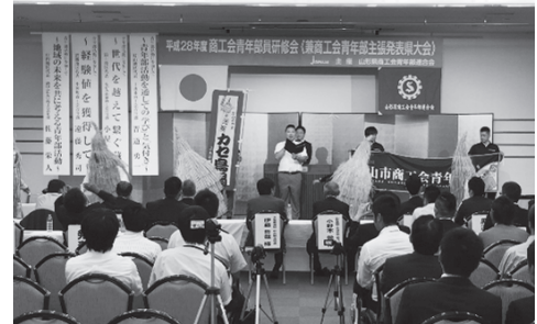
青年部員が加勢鳥に扮して応援をしました